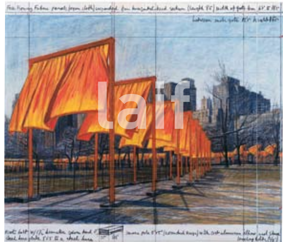
2) Christo, The Gates, Project for Central Park, New York City, 2003, Collage (zweiteilig), Sammlung Würth