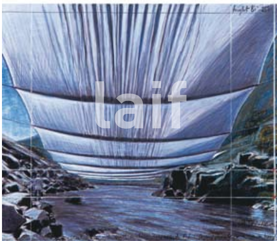
1) Christo, Over the River, Project for the Arkansas River, Colorado, 1993, Collage in zwei Teilen, Sammlung Würth, (3.10.2010)