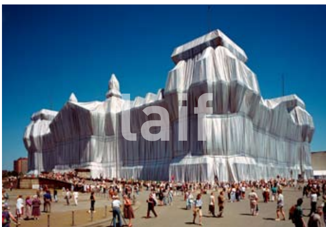
3) Christo und Jeanne-Claude, Wrapped Reichstag, Berlin, 1995, (3.10.2010)